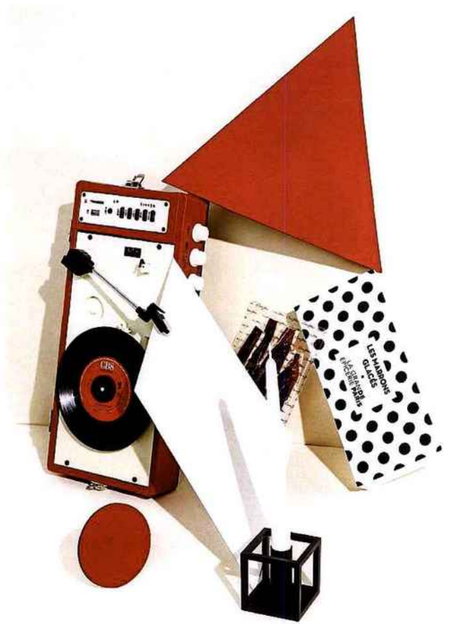
Platine tourne-disque, RICATECH au BHV MARAIS, 166€. Jambon de Bellota, 100% ibérico, CINCO JOTAS, 57€ le coffret de deux étuis de 80 g. Boîte de 12 marrons glacés, LA GRANDE EPICERIE, 31,90€. Bougeoir, BY LASSEN COPENHAGEN chez HOME AUTOUR DU MONDE, 65€.