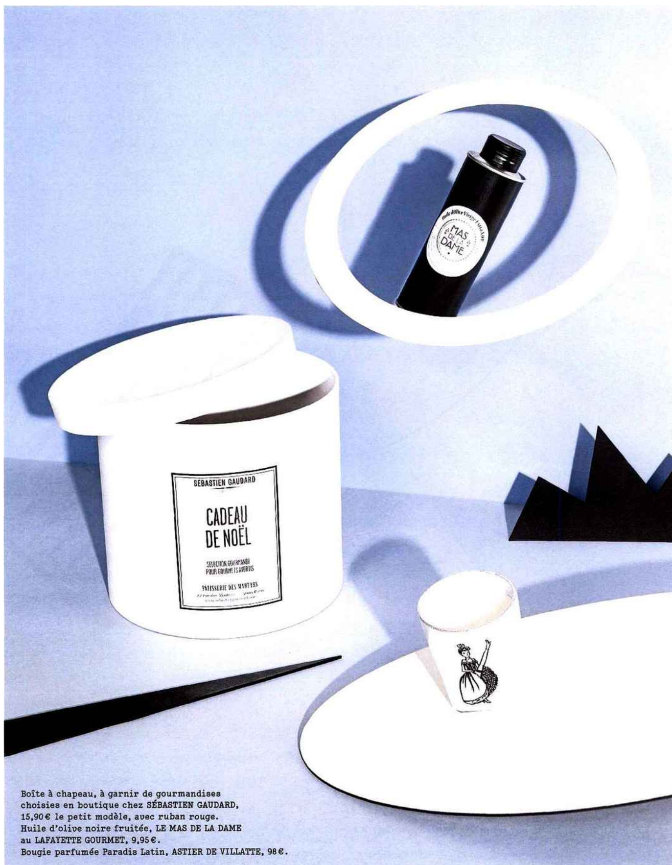
Boîte à chapeau, à garnir de gourmandises choisies en boutique chez SÉBASTIEN GAUDARD, 15,90€ le petit modèle, avec ruban rouge. Huile d'olive noire fruitée, LE MAS DE LA DAME au LAFAYETTE GOURMET, 9,95€. Bougie parfumée Paradis Latin, ASTIER DE VILLATTE, 98€.